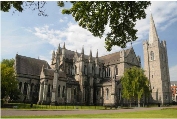
Dag 1: St. Patrick's Cathedral