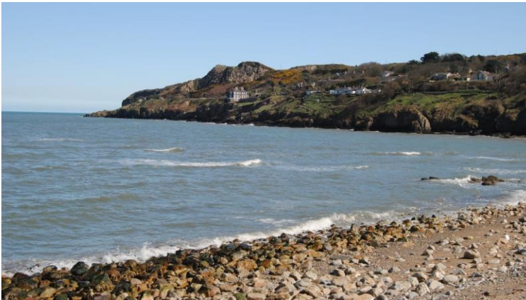
Dag 4 Howth aan Zee