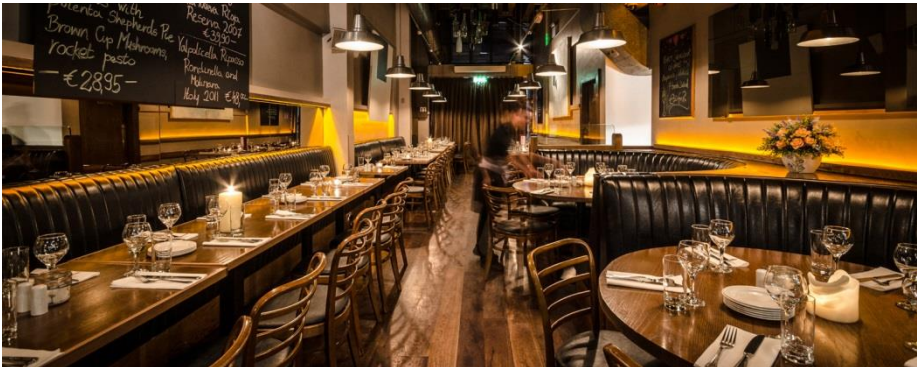
Dag 2: Brasserie Sixty6