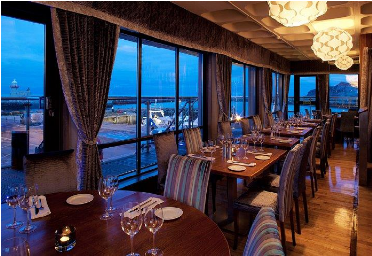
Dag 4 Restaurant Aqua