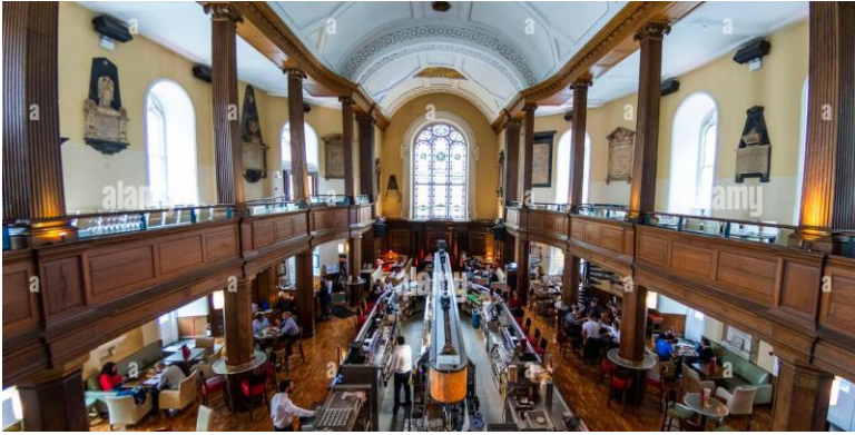
Dag 3 Restaurant The Church