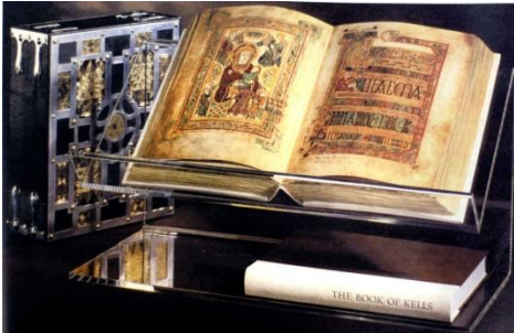
Dag 2 Trinity College en Book of Kells