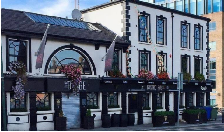
Dag 1 lunch: McCaffertys at the Barge