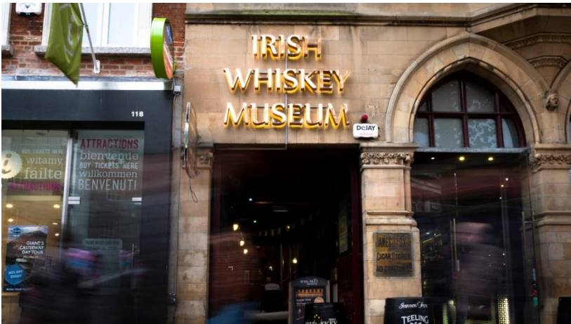
Dag 2 Irish Whisky Museum