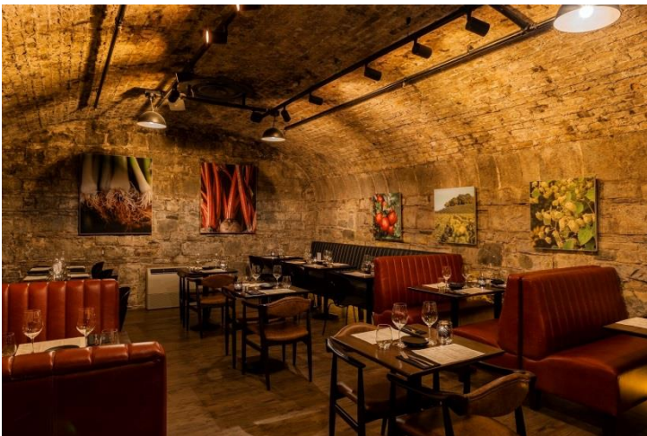
Dag 1 diner: Urban Brewing & Stack A Restaurant